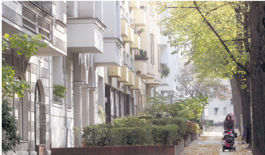
Viele Altbauten mit großzügig geschnittenen Wohnungen säumen die Joachim-Friedrich-Straße (oben links). Rechts die Halensee-Grundschule